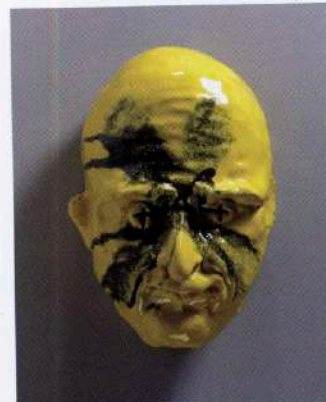
Thomas Schütte, Router Maske, 2014. (Masque bâlé) Céramique émaillée.