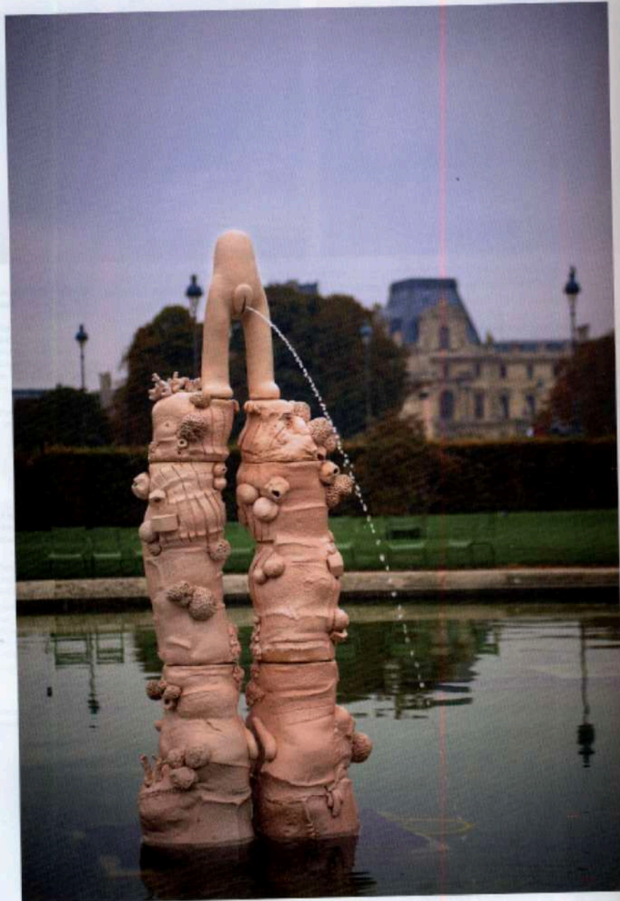
Elba Sahal, Fontaine, FIAC hors les murs, Jardin des Tuileries, Paris, 2012. Céramique émaillée, système hydraulique, 204 x 57 x 42 cm Quatre fois plus in Papiers